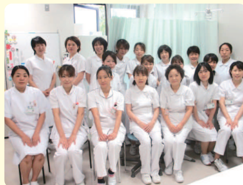
外来棟スタッフ (正職員12名、臨時職員14名)

地域の医療を担う機関として、多くの病院・診療所の皆様と密接な医療連携体制を構築し、お役に立てるよう、日々精進していきたいと考えておりますので、これからもご指導を何卒、宜しくお願いします。