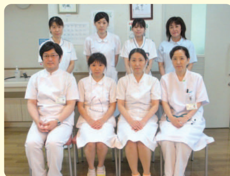
4階病棟スタッフ (正職員25名、臨時職員3名)

4月に糖尿病内科が4階病棟から移動し5階病棟に編成されました。今年中には当病棟に無菌室が装備される予定になっており、各部署で担う役割は多様化し、複雑化しています。これからは変化を恐れず、各スタッフ一人ひとりがより専門的な業務に対応できるよう、又、公私に渡り生き生きと働くことができる環境作りにも取り組んでいきたいと考えています。