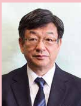
周南市医療公社 副理事長 周南市立 新南陽市民病院 病院長