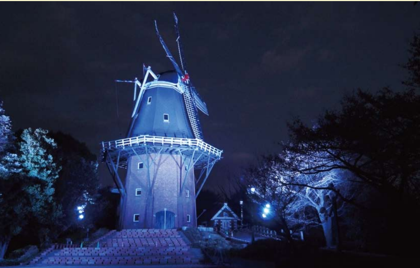
ブルーにライトアップされた永源山ゆめ風車

電話：0834-61-2500 FAX：0834-61-2501 メールアドレス：renkei@city-hp.or.jp ホームページ：http://www.city-hp.or.jp