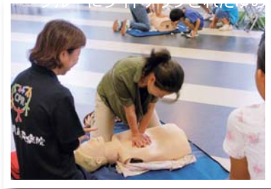
9月 「救急の日記念行事」