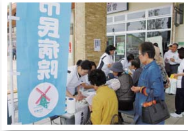
5月 「看護の日記念行事」