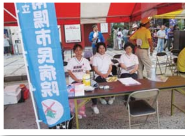
8月 サンフェスタしんなんよう救護所