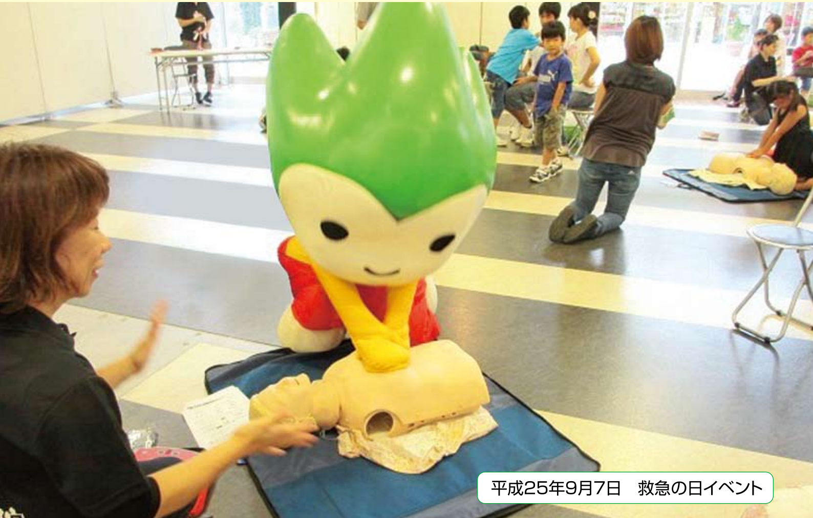
平成25年9月7日 救急の日イベント